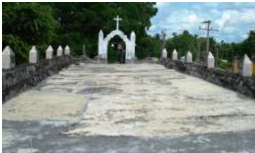
Estado anterior a las obras en azotea del templo

La losa de azotea presenta agrietamiento en algunas áreas y manchas por humedad. Los pretilos de azotea se observan con costras y manchas por humedad. No cuenta con chafalán perimetral. Los bajantes pluviales se encuentran incompletos, con adaptaciones de pvc sanitario y en mal estado. En el interior se observa manchas por humedad en el plafón. Los empotramientos de las vigas de madera presentan desprendimiento de acabado. La pintura en general del interior se encuentra con deterioro. Los pisos son de mosaico de pasta. Se observa decoloración y deterioro en puertas y ventanas. Falta una ventana en el presbiterio. Existen áreas en muros exteriores que presentan manchas por humedad. Existe vegetación nociva en muros. En el lado sur se observó la construcción de un baño.