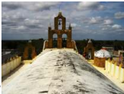
Estado anterior a las obras en la azotea del templo

Se observan manchas por humedad y desprendimientos de aplanados en muros y plafones. En la azotea se observa un sistema de impermeabilización acrílico cuya vida útil ha caducado. Los muros en fachada presentan manchas de humedad. Se observa vegetación nociva en muros y azotea. El desprendimiento de acabados en muros se debe a la humedad y falta de mantenimiento.