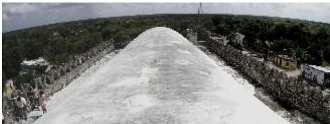
Estado anterior a las obras en la azotea del templo

Se requiere mantenimiento, impermeabilización y pintura del templo (trabajos de albañilería, pintura, impermeabilización, acabados y limpieza).