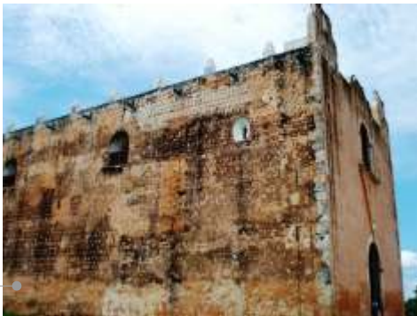
Estado anterior a las obras en los muros exteriores

Se requiere mantenimiento, impermeabilización y pintura del templo (trabajos de albañilería, pintura, impermeabilización, acabados y limpieza) (incluye hasta el 3% de indirectos).