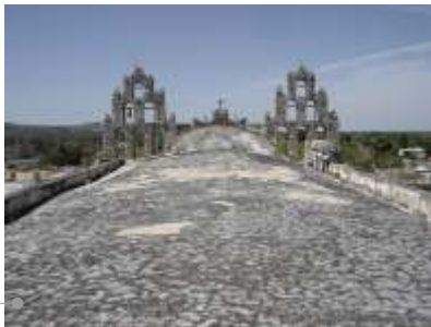
Sistema de impermeabilización en la azotea

Las azoteas requieren elaboración de calcreto y chaflanes. Los aplanados de los muros están deteriorados por lo que se recomienda: limpieza, restitución de faltantes y aplicación de pintura.