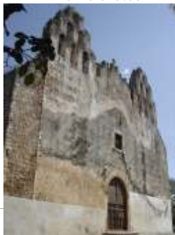
Restitución de aplanados