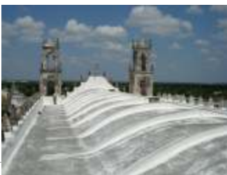
Sistema de impermeabilización en la azotea