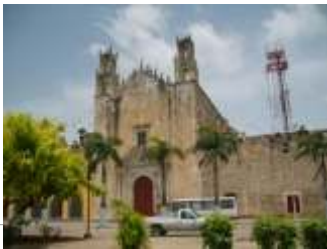
Fachada del inmueble

El sistema de impermeabilización acrílico requiere de un mantenimiento periódico (según especificaciones del fabricante) aplicando una capa de impermeabilizante para evitar que se deteriore la membrana de refuerzo. Las fachadas requieren aplicación de pintura.