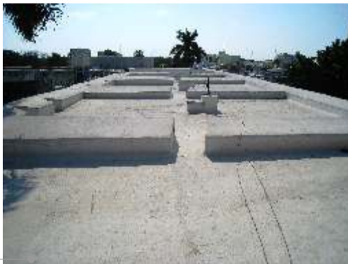
Sistema de impermeabilización acrílico en la azotea

El sistema de impermeabilización acrílico requiere de un mantenimiento periódico (según especificaciones del fabricante) aplicando una capa de impermeabilizante para evitar que se deteriore la membrana de refuerzo. Las fachadas requieren aplicación de pintura.