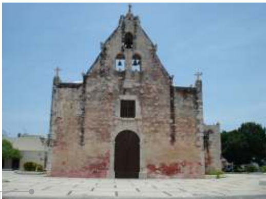
Limpieza general de muros y pintura calestina

El sistema de impermeabilización acrílico requiere de un mantenimiento periódico (según especificaciones del fabricante) aplicando una capa de impermeabilizante para evitar que se deteriore la membrana de refuerzo. Las fachadas requieren aplicación de pintura.