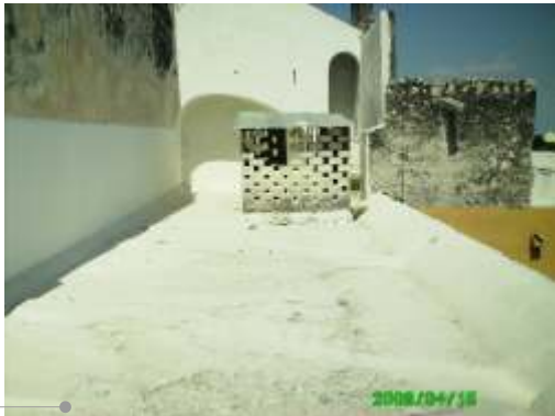
Sistema de impermeabilización acrílico en la azotea

El sistema de impermeabilización acrílico requiere de un mantenimiento periódico (según especificaciones del fabricante) aplicando una capa de impermeabilizante para evitar que se deteriore la membrana de refuerzo. Las fachadas requieren aplicación de pintura.