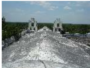
Sistema de impermeabilización acrílico en la azotea