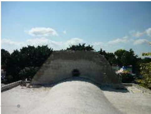
Sistema de impermeabilización acrílico en la azotea

El sistema de impermeabilización acrílico requiere de un mantenimiento periódico (según especificaciones del fabricante) aplicando una capa de impermeabilizante para evitar que se deteriore la membrana de refuerzo. Las fachadas requieren aplicación de pintura.