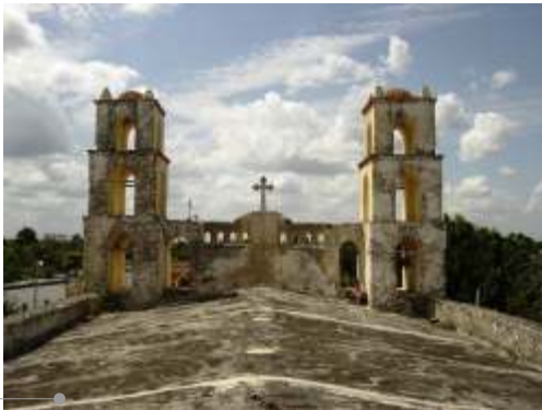
Sistema de impermeabilización acrílico en la azotea

El sistema de impermeabilización acrílico requiere de un mantenimiento periódico (según especificaciones del fabricante) aplicando una capa de impermeabilizante para evitar que se deteriore la membrana de refuerzo. Las fachadas requieren aplicación de pintura.