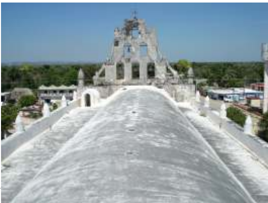
Azotea del templo

Las azoteas requieren de un sistema de impermeabilización acrílico con membrana de refuerzo. Los aplanados de los muros están deteriorados por lo que se recomienda: limpieza, restitución de faltantes y aplicación de pintura.