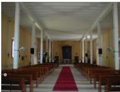
Interior del templo

Las azoteas requieren de un sistema de impermeabilización acrílico con membrana de refuerzo. Los aplanados de los muros están deteriorados por lo que se recomienda: limpieza, restitución de faltantes y aplicación de pintura. En el interior del templo, el presbiterio original se encuentra separado de la nave por un muro de construcción reciente.