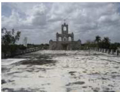
Azotea del templo