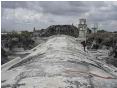
Sistema de impermeabilización acrílico en la azotea

El sistema de impermeabilización acrílico requiere de un mantenimiento periódico (según especificaciones del fabricante) aplicando una capa de impermeabilizante para evitar que se deteriore la membrana de refuerzo. Las fachadas requieren aplicación de pintura.