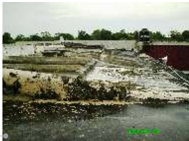
Mantenimiento en azoteas

El sistema de impermeabilización acrílico requiere de un mantenimiento periódico (según especificaciones del fabricante) aplicando una capa de impermeabilizante para evitar que se deteriore la membrana de refuerzo. Las fachadas requieren aplicación de pintura.