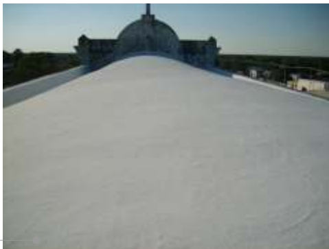
Sistema de impermeabilización acrílica en la azotea

El sistema de impermeabilización acrílica requiere de un mantenimiento periódico (según especificaciones del fabricante) aplicando una capa de impermeabilizante para evitar que se deteriore la membrana de refuerzo. Las fachadas requieren aplicación de pintura.