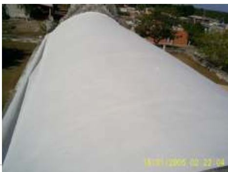
Sistema de impermeabilización acrílico en la azotea

El sistema de impermeabilización acrílico requiere de un mantenimiento periódico (según especificaciones del fabricante) aplicando una capa de impermeabilizante para evitar que se deteriore la membrana de refuerzo. Las fachadas requieren aplicación de pintura.