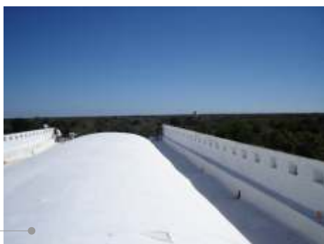
Sistema de impermeabilización acrílico en la azotea

El sistema de impermeabilización acrílico requiere de un mantenimiento periódico (según especificaciones del fabricante) aplicando una capa de impermeabilizante para evitar que se deteriore la membrana de refuerzo. Se necesita consolidar la fachada principal. Las fachadas requieren aplicación de pintura.