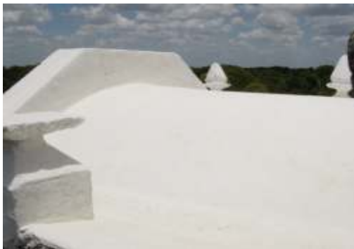
Sistema de impermeabilización acrílico en la azotea del presbiterio.

El sistema de impermeabilización acrílico requiere de un mantenimiento periódico (según especificaciones del fabricante) aplicando una capa de impermeabilizante para evitar que se deteriore la membrana de refuerzo. Se necesita consolidar la fachada principal. Las fachadas requieren aplicación de pintura.