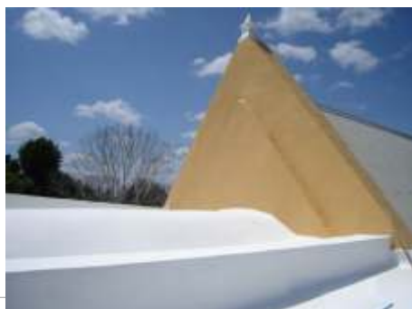
Sistema de impermeabilización acrílico en la azotea del presbiterio

El sistema de impermeabilización acrílico requiere de un mantenimiento periódico (según especificaciones del fabricante) aplicando una capa de impermeabilizante para evitar que se deteriore la membrana de refuerzo. Las fachadas requieren aplicación de pintura.