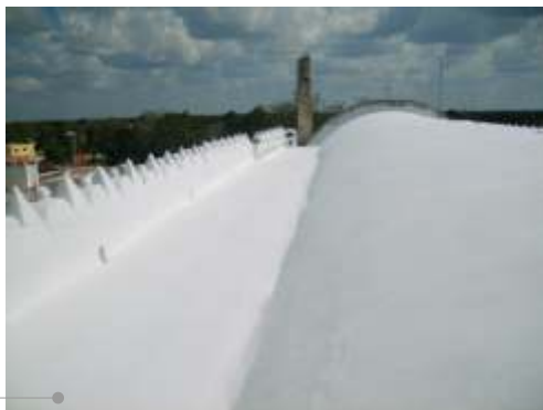
Sistema de impermeabilización acrílico en la azotea

El sistema de impermeabilización acrílico requiere de un mantenimiento periódico (según especificaciones del fabricante) aplicando una capa de impermeabilizante para evitar que se deteriore la membrana de refuerzo. Las fachadas requieren aplicación de pintura.