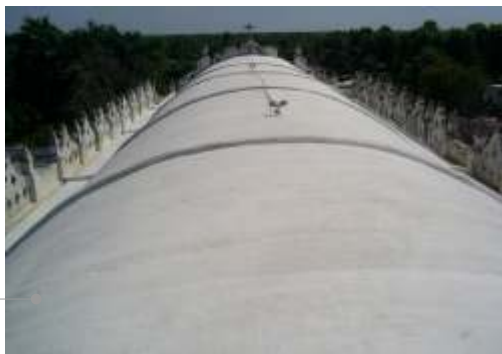
Sistema de impermeabilización acrílico

El sistema de impermeabilización acrílico requiere de un mantenimiento periódico (según especificaciones del fabricante) aplicando una capa de impermeabilizante para evitar que se deteriore la membrana de refuerzo. Las fachadas requieren aplicación de pintura.