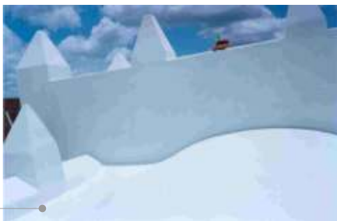
Sistema de impermeabilización acrílico en la azotea

El sistema de impermeabilización acrílico requiere de un mantenimiento periódico (según especificaciones del fabricante) aplicando una capa de impermeabilizante para evitar que se deteriore la membrana de refuerzo. Las fachadas requieren aplicación de pintura.