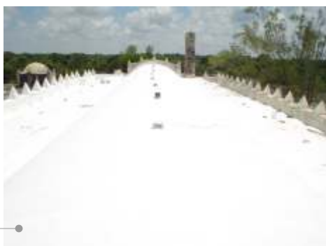
Sistema de impermeabilización acrílico en azotea

El sistema de impermeabilización acrílico requiere de un mantenimiento periódico (según especificaciones del fabricante) aplicando una capa de impermeabilizante para evitar que se deteriore la membrana de refuerzo. Las fachadas requieren aplicación de pintura.