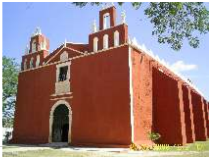
FACHADA ACTUAL DEL INMUEBLE