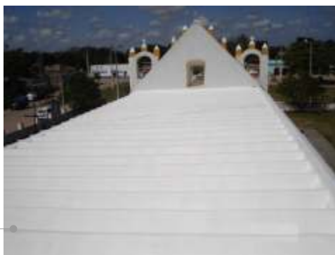
Impermeabilización de cubierta

El sistema de impermeabilización acrílico requiere de un mantenimiento periódico (según especificaciones del fabricante) aplicando una capa de impermeabilizante para evitar que se deteriore la membrana de refuerzo. Falta pintura en las fachadas