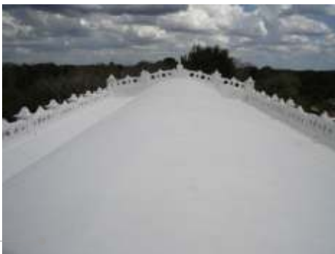
Sistema de impermeabilización acrílico en la azotea

El sistema de impermeabilización acrílico requiere de un mantenimiento periódico (según especificaciones del fabricante) aplicando una capa de impermeabilizante para evitar que se deteriore la membrana de refuerzo. Las fachadas requieren aplicación de pintura.