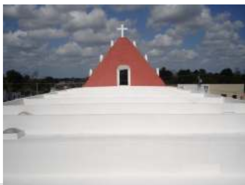
Sistema de impermeabilización acrílico en la azotea

El sistema de impermeabilización acrílico requiere de un mantenimiento periódico (según especificaciones del fabricante) aplicando una capa de impermeabilizante para evitar que se deteriore la membrana de refuerzo. Las fachadas requieren aplicación de pintura.