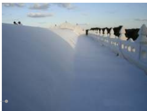
Sistema de impermeabilización acrílico

El sistema de impermeabilización acrílico requiere de un mantenimiento periódico (según especificaciones del fabricante) aplicando una capa de impermeabilizante para evitar que se deteriore la membrana de refuerzo. Las fachadas requieren aplicación de otra capa de pintura.