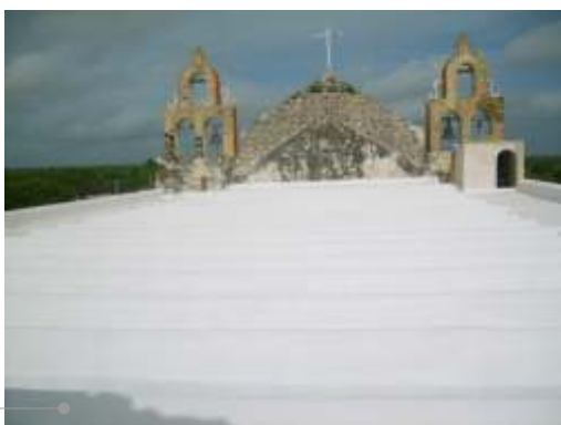
Sistema de impermeabilización acrílico en la azotea

El sistema de impermeabilización acrílico requiere de un mantenimiento periódico (según especificaciones del fabricante) aplicando una capa de impermeabilizante para evitar que se deteriore la membrana de refuerzo. Las fachadas requieren aplicación de pintura.