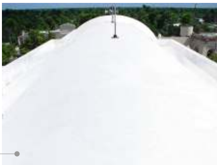
Sistema de impermeabilización acrílico

El sistema de impermeabilización acrílico requiere de un mantenimiento periódico (según especificaciones del fabricante) aplicando una capa de impermeabilizante para evitar que se deteriore la membrana de refuerzo. Las fachadas requieren aplicación de otra capa de pintura.