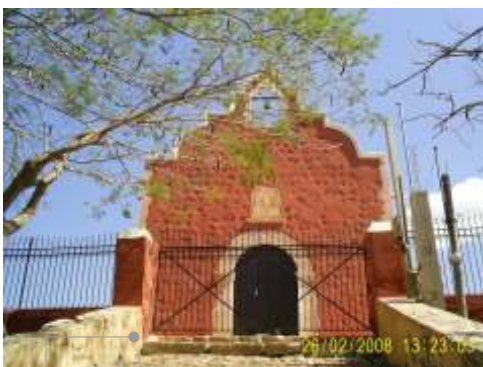
FACHADA ACTUAL DEL INMUEBLE