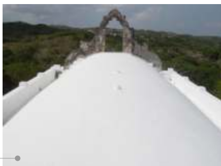
Sistema de impermeabilización acrílico en la azotea

El sistema de impermeabilización acrílico requiere de un mantenimiento periódico (según especificaciones del fabricante) aplicando una capa de impermeabilizante para evitar que se deteriore la membrana de refuerzo. Las fachadas requieren aplicación de pintura.