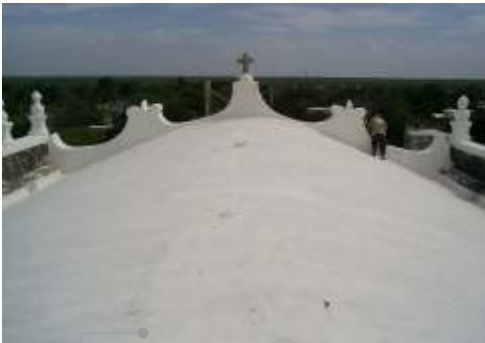
Vista de la azotea

El sistema de impermeabilización acrílico requiere de un mantenimiento periódico (según especificaciones del fabricante) aplicando una capa de impermeabilizante para evitar que se deteriore la membrana de refuerzo. Las fachadas requieren aplicación de pintura.