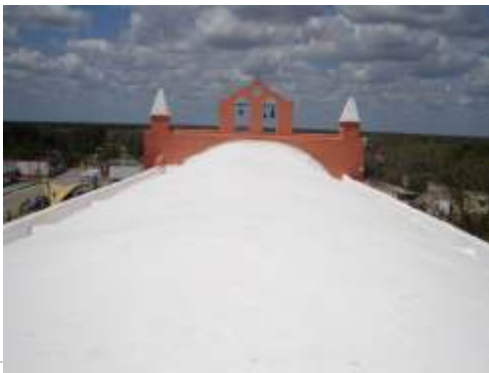
Sistema de impermeabilización acrílico en la azotea

El sistema de impermeabilización acrílico requiere de un mantenimiento periódico (según especificaciones del fabricante) aplicando una capa de impermeabilizante para evitar que se deteriore la membrana de refuerzo. Las fachadas requieren aplicación de pintura.