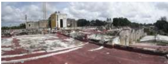
Vista de la azotea

El sistema de impermeabilización asfáltico está deteriorado por lo que hay filtraciones y manchas de humedad. Se observaron desprendimientos de aplanados en los muros y microorganismos como hongos y líquenes. Las fachadas requieren aplicación de pintura.