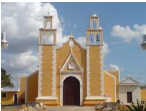
VISTA DEL COSTADO SUR DEL INMUEBLE