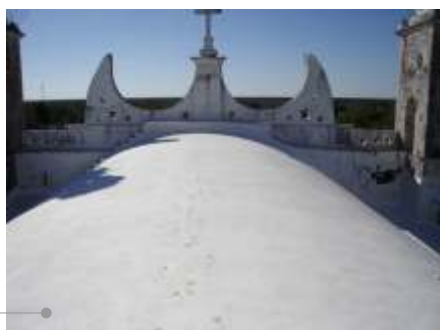
Sistema de impermeabilización acrílico

El sistema de impermeabilización acrílico requiere de un mantenimiento periódico (según especificaciones del fabricante) aplicando una capa de impermeabilizante para evitar que se deteriore la membrana de refuerzo. Las fachadas requieren aplicación de otra capa de pintura.