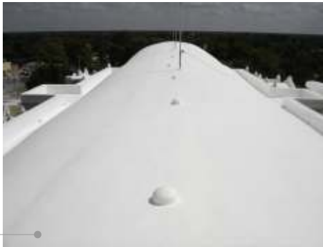
Sistema de impermeabilización acrílico en la azotea

El sistema de impermeabilización acrílico requiere de un mantenimiento periódico (según especificaciones del fabricante) aplicando una capa de impermeabilizante para evitar que se deteriore la membrana de refuerzo. Las fachadas requieren aplicación de pintura.