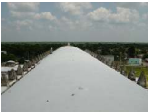
Sistema de impermeabilización acrílico

El sistema de impermeabilización acrílico requiere de un mantenimiento periódico (según especificaciones del fabricante) aplicando una capa de impermeabilizante para evitar que se deteriore la membrana de refuerzo. Las fachadas requieren aplicación de pintura.