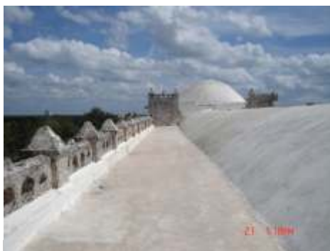
Sistema de impermeabilización acrílico en la azotea

El sistema de impermeabilización acrílico requiere de un mantenimiento periódico (según especificaciones del fabricante) aplicando una capa de impermeabilizante para evitar que se deteriore la membrana de refuerzo. Las fachadas requieren aplicación de pintura.