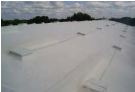
Sistema de impermeabilización acrílico en la azotea

El sistema de impermeabilización acrílico requiere de un mantenimiento periódico (según especificaciones del fabricante) aplicando una capa de impermeabilizante para evitar que se deteriore la membrana de refuerzo. Las fachadas requieren aplicación de pintura.