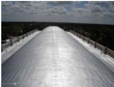
Sistema de impermeabilización

El sistema de impermeabilización acrílico requiere de un mantenimiento periódico (según especificaciones del fabricante) aplicando una capa de impermeabilizante para evitar que se deteriore la membrana de refuerzo. Las fachadas requieren aplicación de pintura.