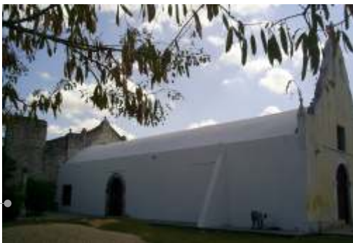
Impermeabilización de cubierta y pintura en muros.

El sistema de impermeabilización acrílico requiere de un mantenimiento periódico (según especificaciones del fabricante) aplicando una capa de impermeabilizante para evitar que se deteriore la membrana de refuerzo. Las fachadas requieren aplicación de pintura.