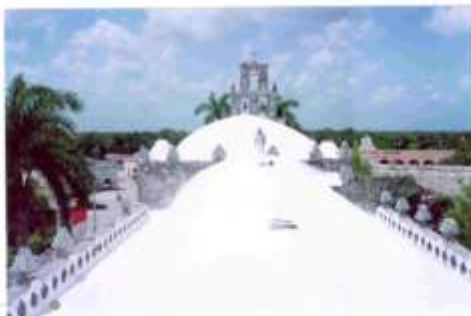
Sistema de impermeabilización acrílico en la azotea

El sistema de impermeabilización acrílico requiere de un mantenimiento periódico (según especificaciones del fabricante) aplicando una capa de impermeabilizante para evitar que se deteriore la membrana de refuerzo. Las fachadas requieren aplicación de pintura.