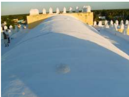
Sistema de impermeabilización acrílica en la azotea

El sistema de impermeabilización acrílico requiere de un mantenimiento periódico (según especificaciones del fabricante) aplicando una capa de impermeabilizante para evitar que se deteriore la membrana de refuerzo. Las fachadas requieren aplicación de pintura.