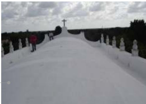
Sistema de impermeabilización acrílico

El sistema de impermeabilización acrílico requiere de un mantenimiento periódico (según especificaciones del fabricante) aplicando una capa de impermeabilizante para evitar que se deteriore la membrana de refuerzo. Las fachadas requieren aplicación de pintura.