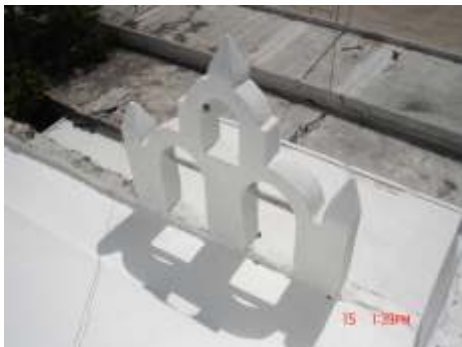
Sistema de impermeabilización acrílico en la azotea

El sistema de impermeabilización acrílico requiere de un mantenimiento periódico (según especificaciones del fabricante) aplicando una capa de impermeabilizante para evitar que se deteriore la membrana de refuerzo. Las fachadas requieren aplicación de otra capa de pintura.