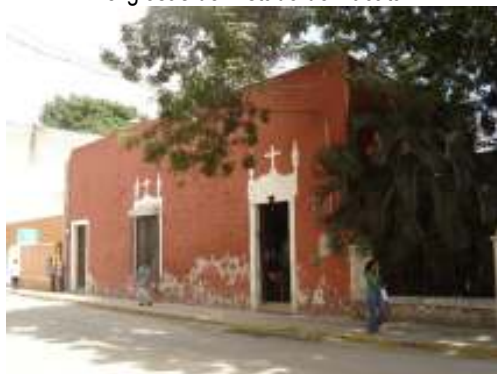
Fotografía 2. Fachada principal de anexo. Se observa desprendimiento de aplanados