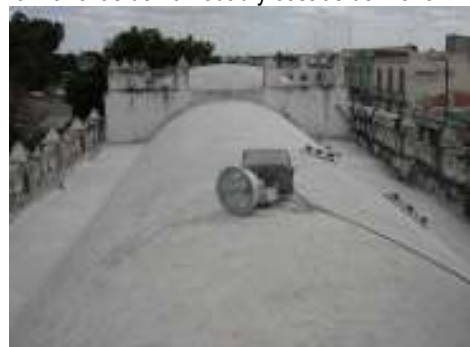
Fotografía 3. Bóveda del templo, se observa costras de moho en los pretilos