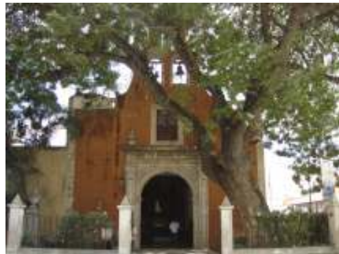
Fotografía 1. Vista de la fachada principal del templo, se observa manchas de humedad y costras de moho.