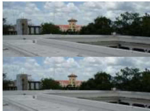
Fotografía 4. Vista de azotea. Se observa la aplicación de un sistema de impermeabilización acrílico con membrana de refuerzo.