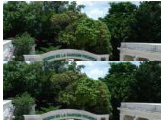
Fotografía 2. Vista del Patio interior. Se observa al fondo el teatro.