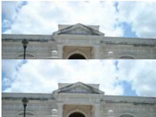
Fotografía 1. Vista de Fachada Principal.